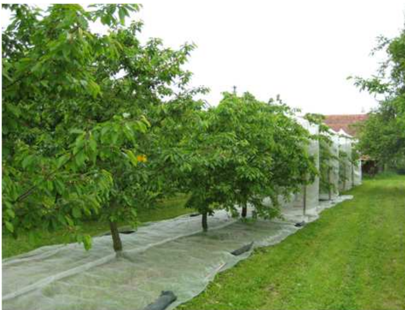
Tab. 1: Ergebnisse der Auswertung vom 26.06.09